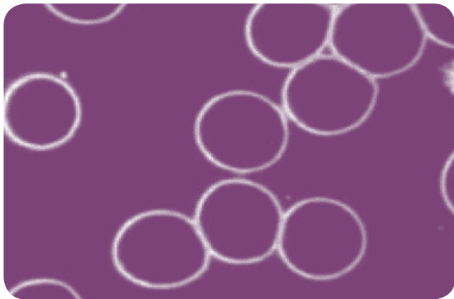
Sujet numéro 2

Analyse : Aucune pollution présente, système immunitaire renforcé.